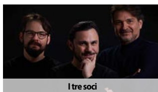
I tre soci

Fornace incorpora Esserrecom: nasce un hub creativo da 2,3 milioni di fatturato